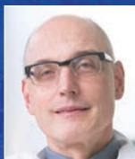
Dr. Jörn H. Witt St. Antonius- Hospital Gronau